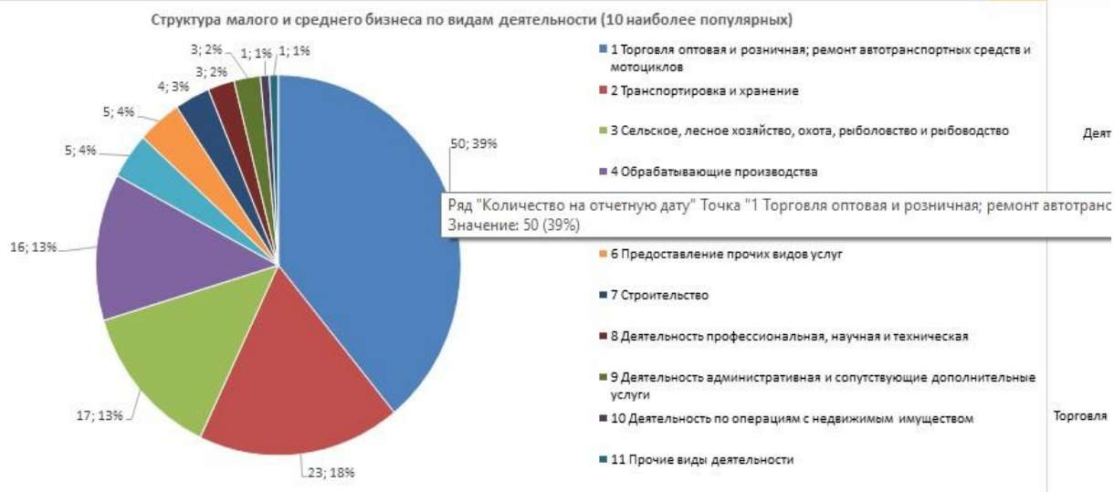
График 2. Структура малого и среднего предпринимательства в муниципальном образовании – Ершичский район Смоленской области по видам деятельности