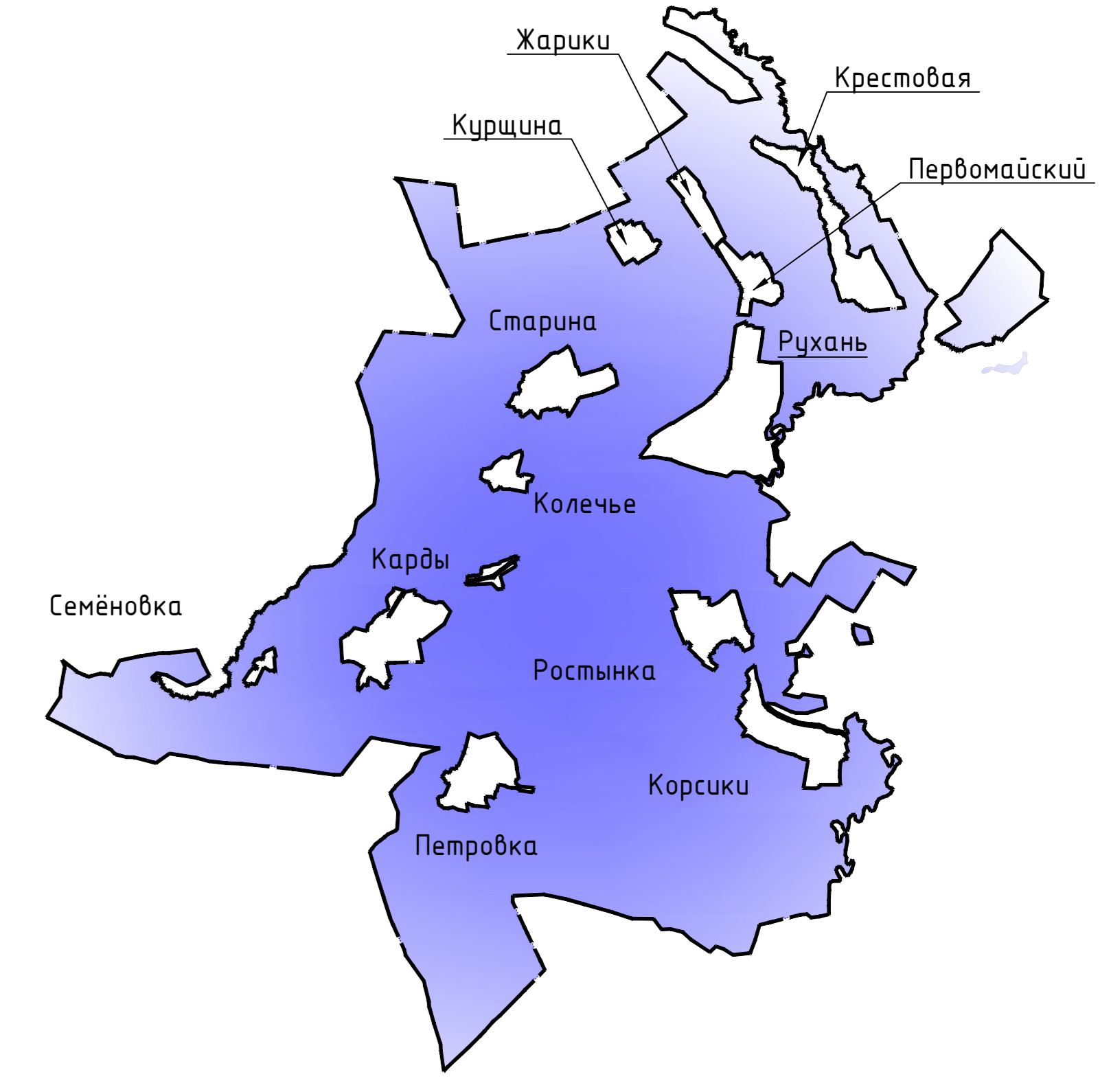
Схема расположения населенных пунктов на территории Руханского сельского поселения (ранее Руханское) Ершичского района Смоленской области