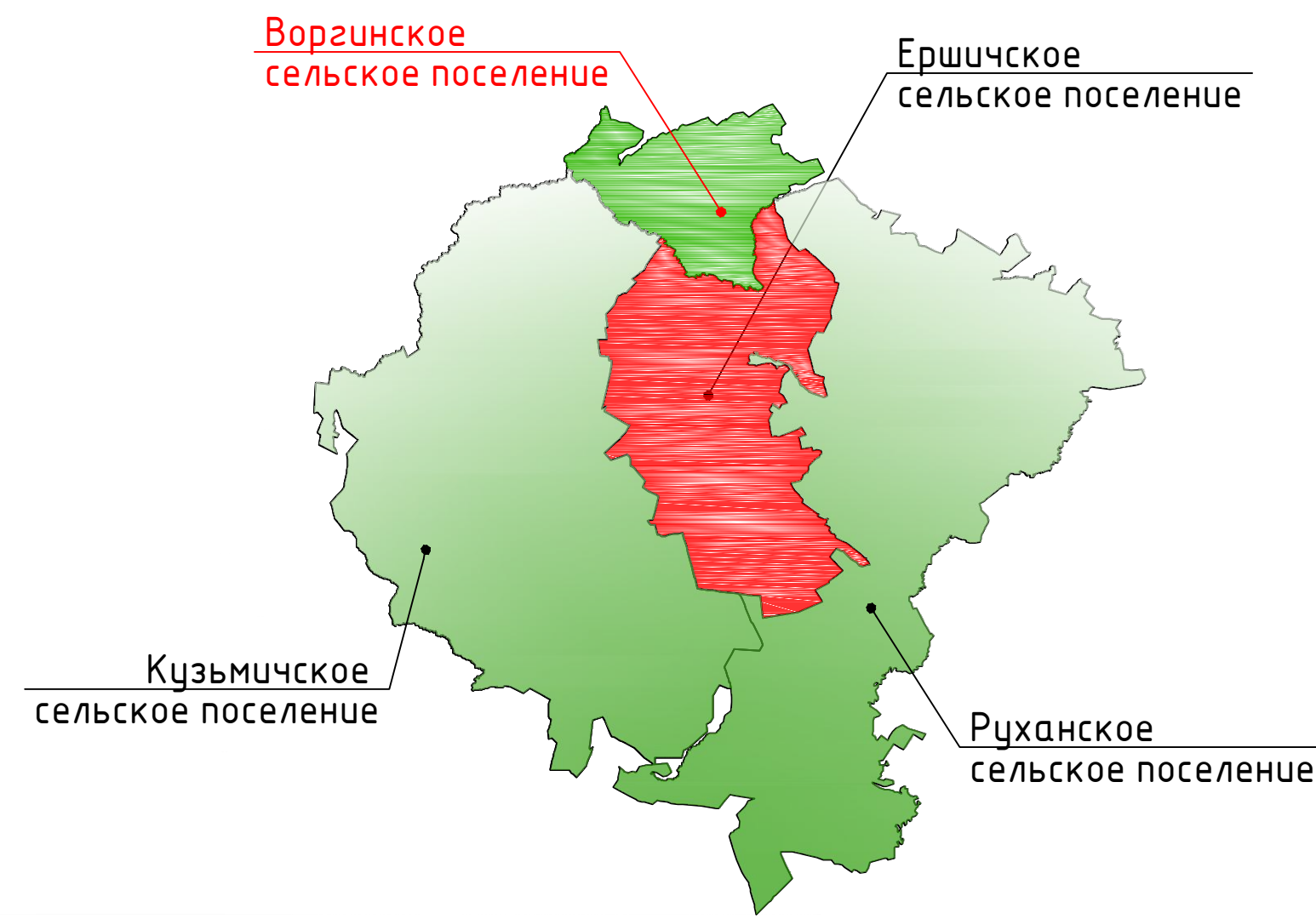
Схема расположения Воргинского сельского поселения Ершичского района Смоленской области

Карта территорий, подверженных риску возникновения чрезвычайных ситуаций природного и техногенного характера. М 1:10000.