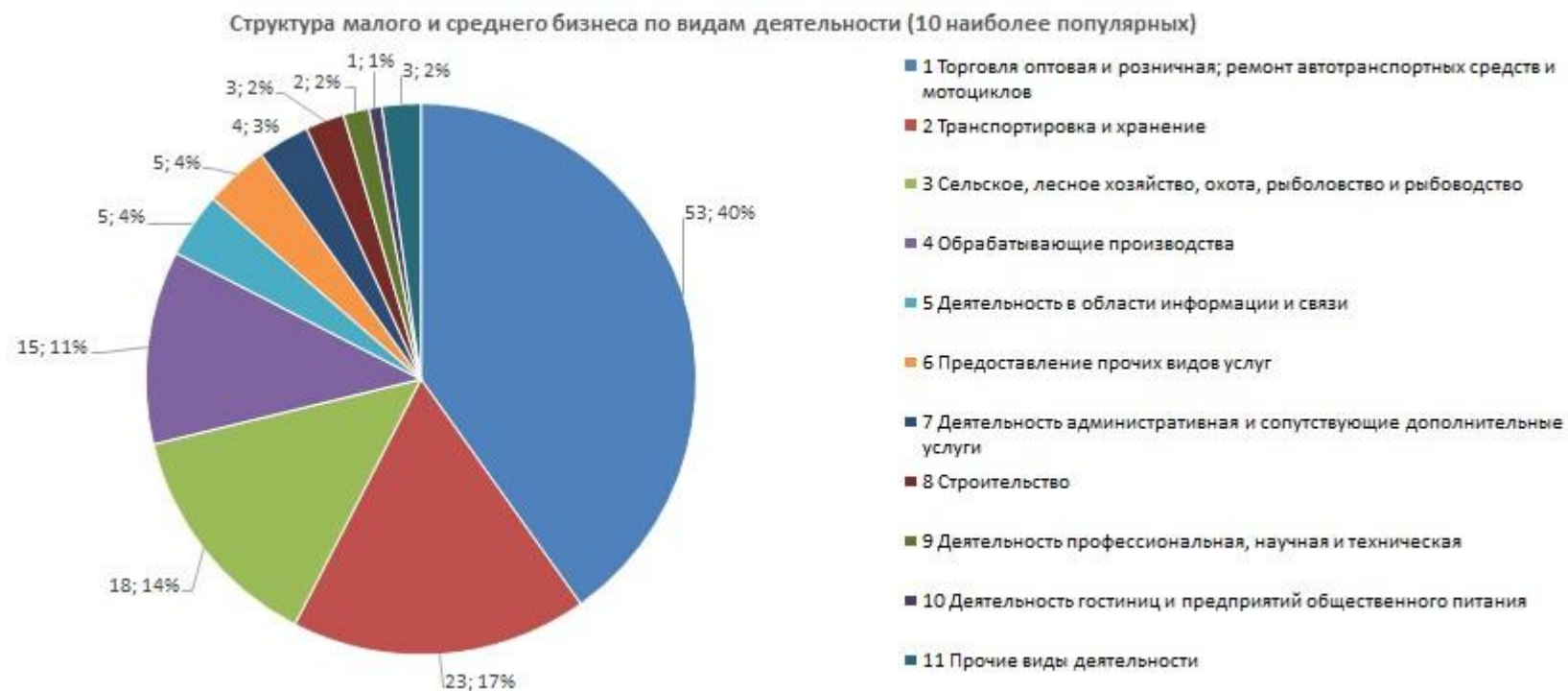
График 2. Структура малого и среднего предпринимательства в муниципальном образовании – Ершичский район Смоленской области по видам деятельности

Относительно невысокий темп прироста количества ИП может быть связан с растущей популярностью применения статуса плательщика налога на профессиональный доход (самозанятость) среди физических лиц, осуществляющих коммерческую деятельность. Благодаря простой регистрации и невысокой налоговой нагрузке большое количество предпринимателей предпочитает этот режим регистрации классического ИП.